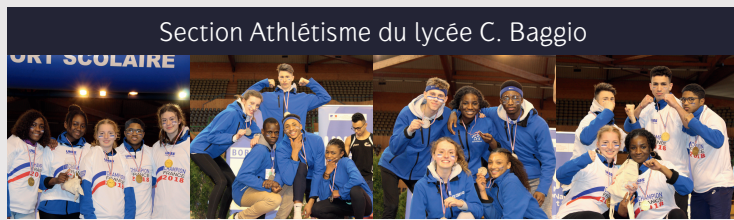
Section Athlétisme du lycée C. Baggio